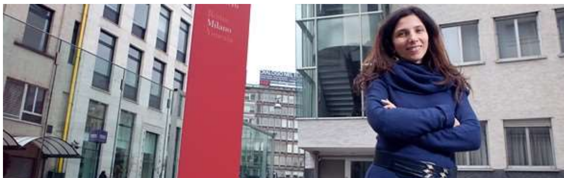
Figure 2 : Stages universitaires fédéraux

Les conditions générales pour le stage universitaire se trouvent sur la page d'accueil du gouvernement fédéral ; elles sont basées sur l'Office fédéral du personnel.