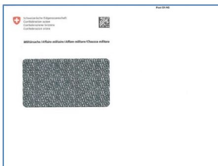
06.151 enveloppe C5 avec fenêtre