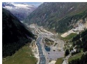
Piazza di tiro di Hinterrhein