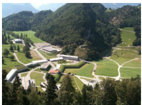
Piazza di tiro St. Luzisteig