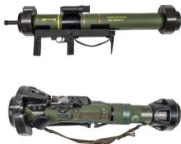
Arma polivalente spalleggiabile