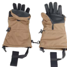
Guanti antifreddo 17