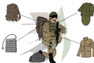
SMAE (Sistema modulare di abbigliamento e equipaggiamento)