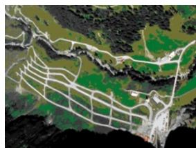
Piazza di tiro di Wichlen