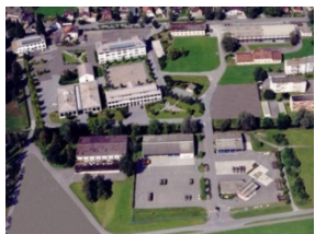
Piazza d'armi di Walenstadt