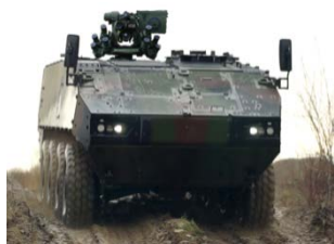
Nuova generazione carro granatiere ruotato