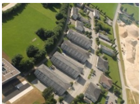
Piazza d'armi di Bure