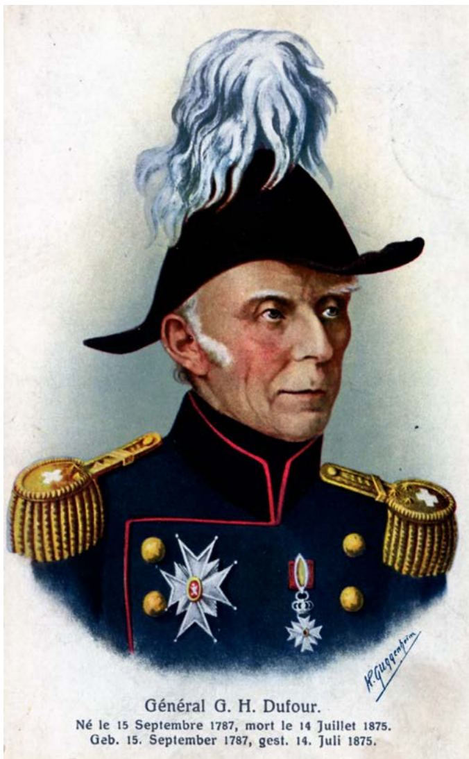
Abbildung 1: General G. H. Dufour.

«Soldaten! Ihr müsst aus diesem Kampf nicht nur siegreich, sondern auch vorwurfsfrei hervorgehen. Ich stelle also unter Euren Schutz die Kinder, die Frauen, die Greise und die Diener der Religion. Die Gefangenen und besonders die Verwundeten verdienen umso mehr Eure Berücksichtigung und Euer Mitleid, als ihr Euch oft mit ihnen in demselben Lager zusammengefunden habt.»