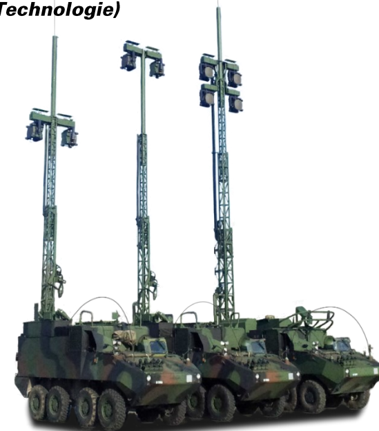
Kdo FU SKS "LEISTUNG ERMÖGLICHEN"