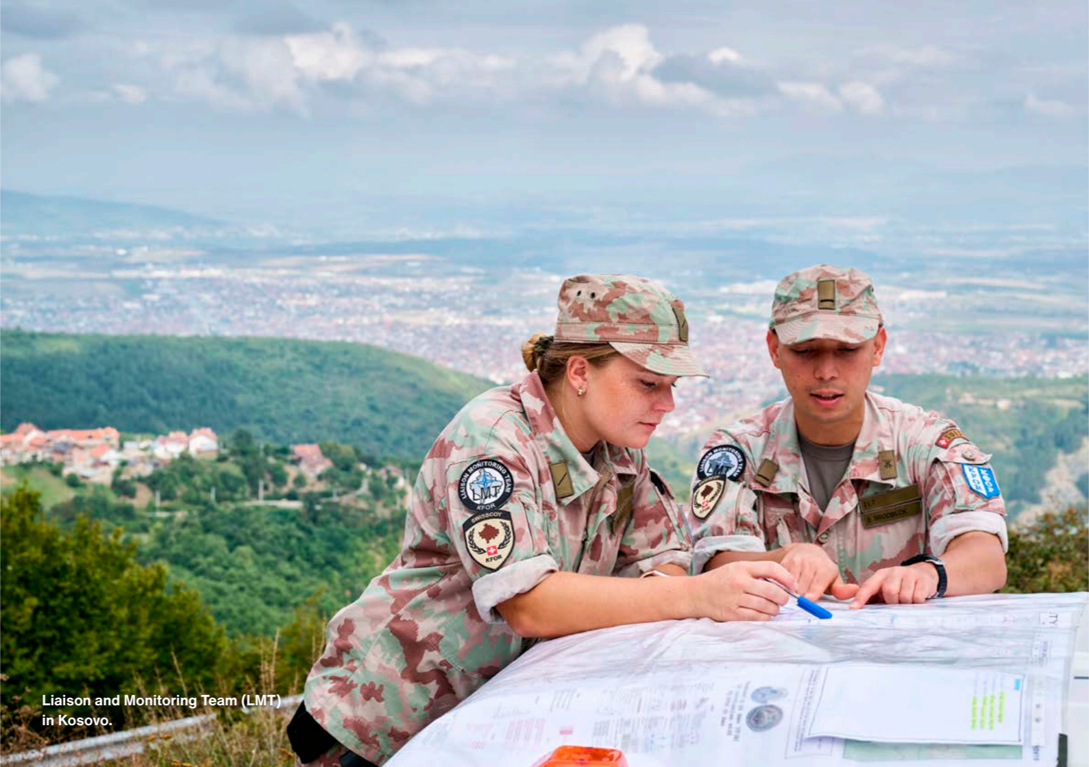
Liaison and Monitoring Team (LMT) in Kosovo.

* Per certe funzioni è determinante il know-how civile, per cui le donne possono svolgere un impiego anche senza aver assolto la scuola reclute. Vengono istruite ed equipaggiate sul piano militare a seconda della rispettiva funzione.