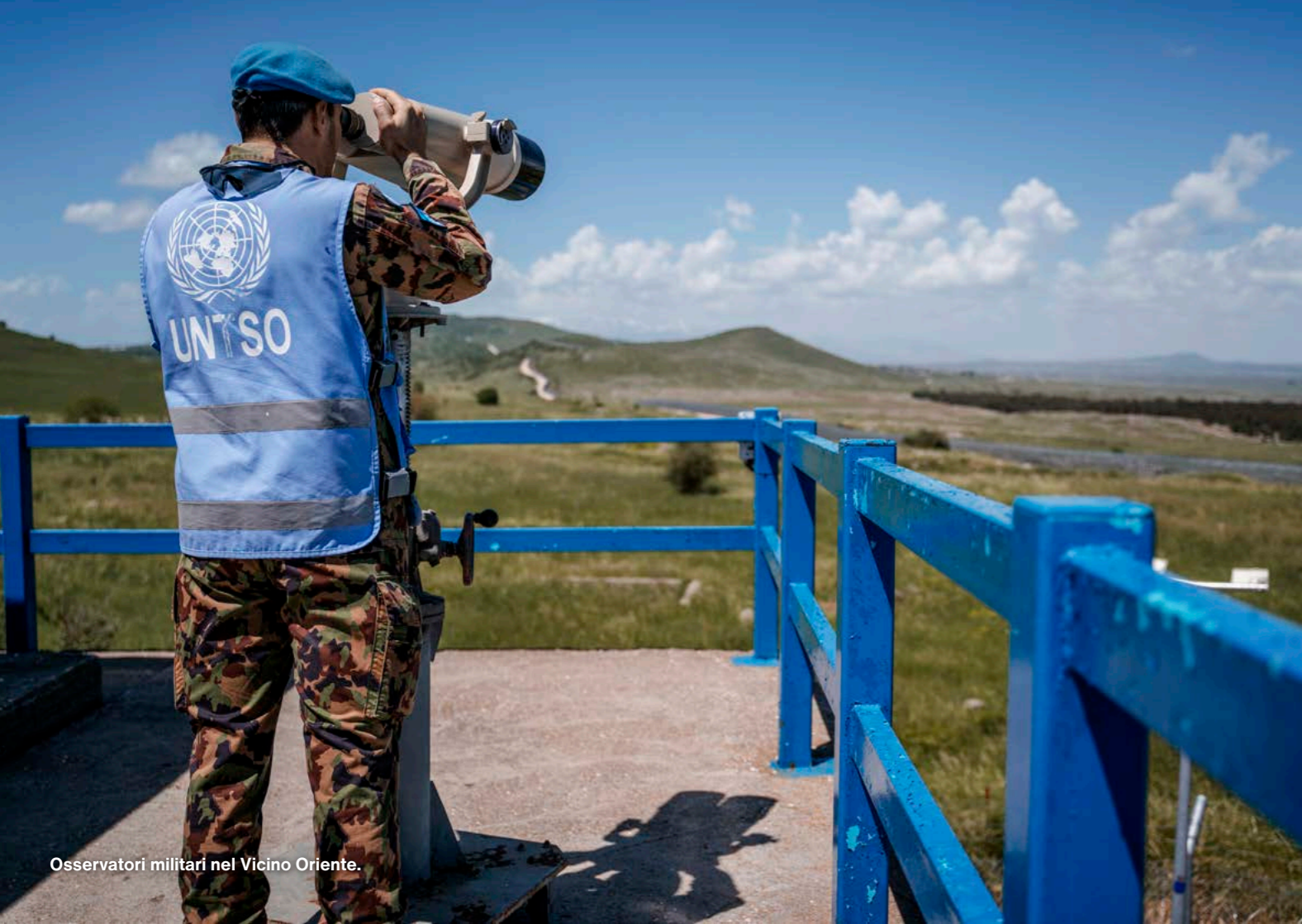
Osservatori militari nel Vicino Oriente.