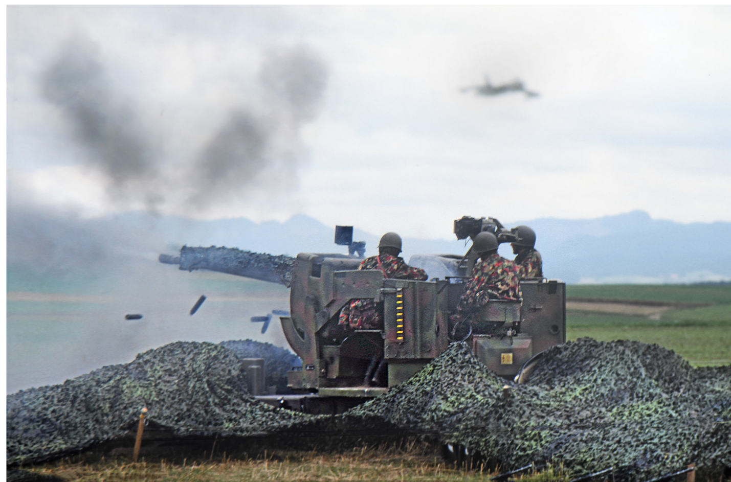
Kanonenschieszen mit 35mm Zerfallsmunition