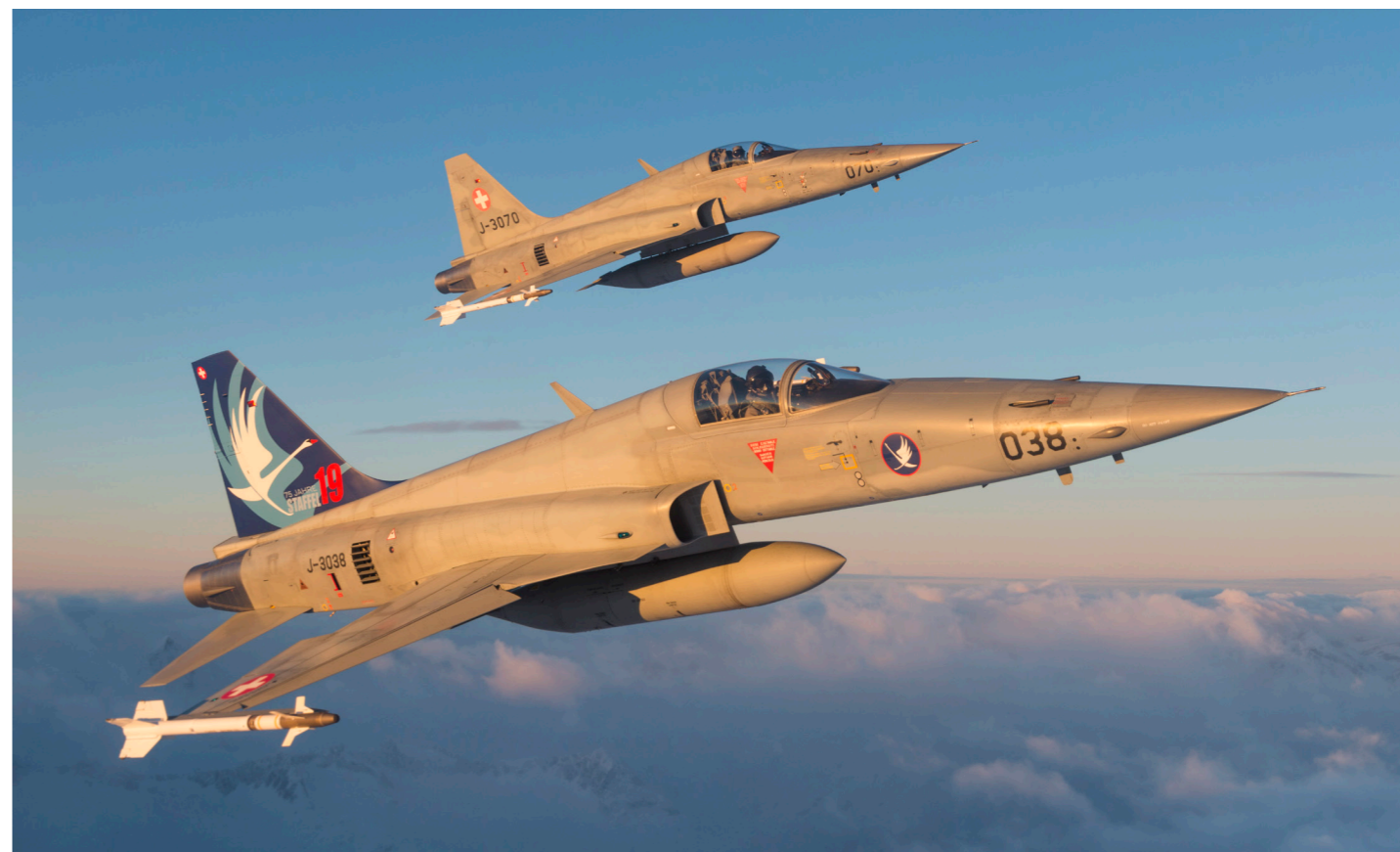
Patrouille Northrop Tiger F-5E