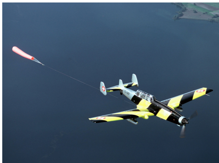
C-3605 mit Schleppsack