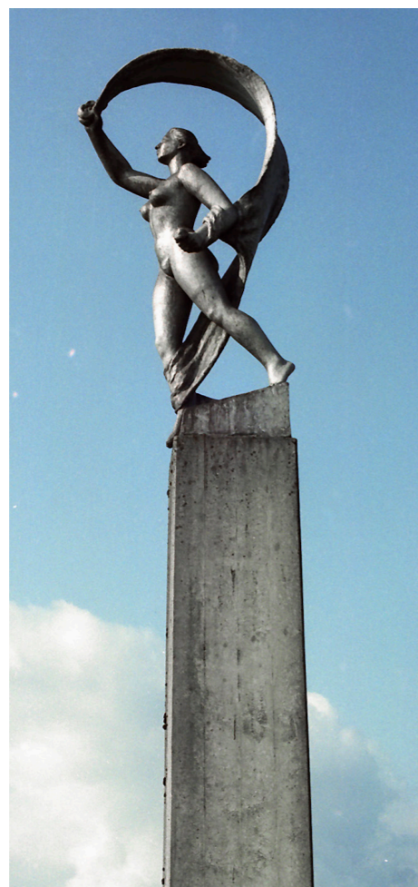
Statue des Künstlers Roland Duss.