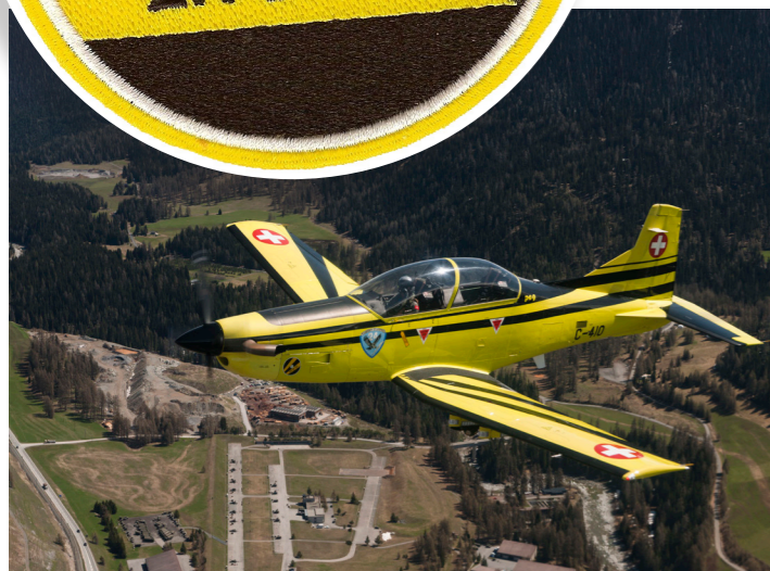
PC-9 über S-chanf