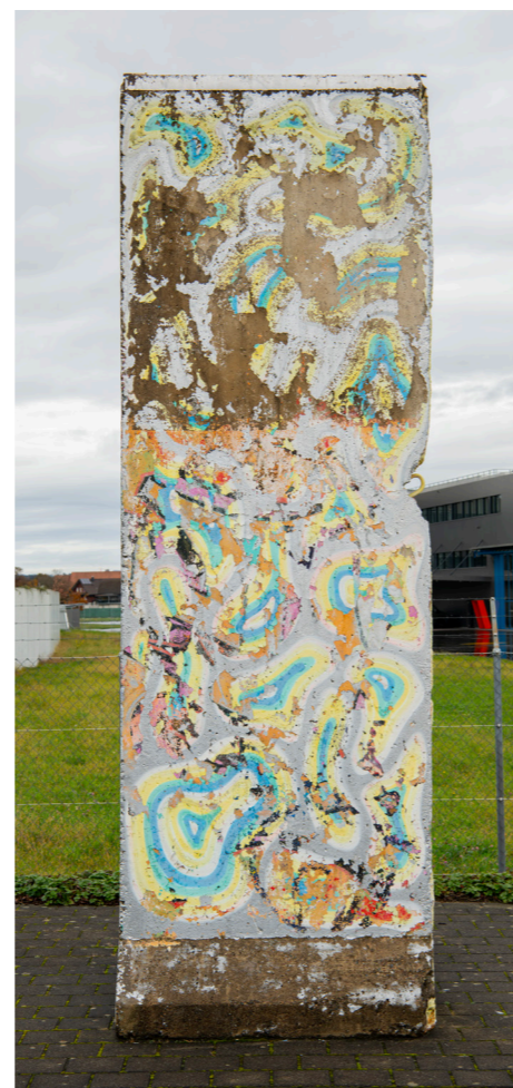
Stück Berliner Mauer.

Auf einem hohen Sockel vor der Flugzeughalle 1 steht eine Statue des Künstlers Roland Duss. Es ist eine Figur, die den Flug symbolisieren soll. Unternehmer von nah und fern und Gönner der Gemeinde Emmen liessen das Denkmal herstellen. Dies zum Dank an die damalige Flugwaffe für die Bewahrung vor dem 2. Weltkrieg. Im Namen der Donatoren wurde sie 1949 dem Eidg. Militär-Departement Abteilung Flugwesen und Fliegerabwehr übergeben. Der Flugplatz und die Kaserne Emmen – gebaut in den Jahren des zweiten Weltkrieges – waren für sie ein Wahrzeichen der Bereitschaft zur Verteidigung des Luftraumes unseres Vaterlandes. In der Schenkungs-Urkunde steht geschrieben: «Möge das Denkmal stets als Sinnbild für die Verteidigung des Vaterlandes erhalten bleiben».