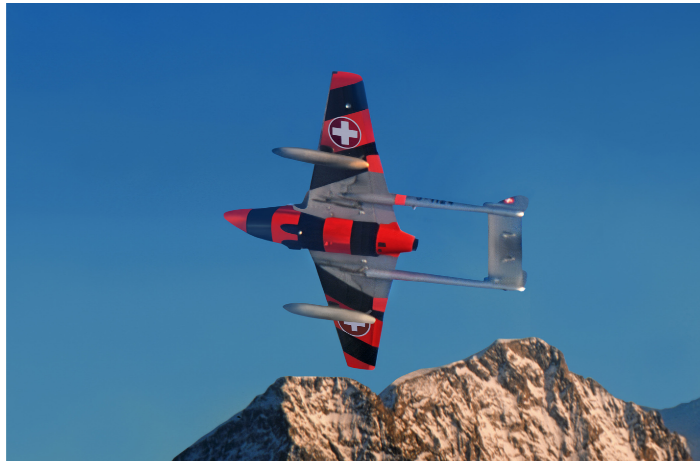
DH-100 VAMPIRE