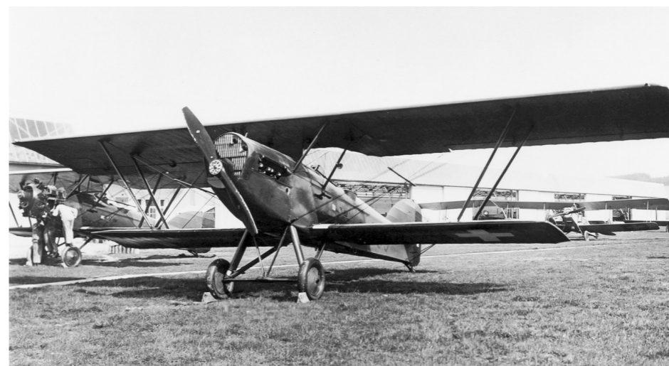
Potez 25