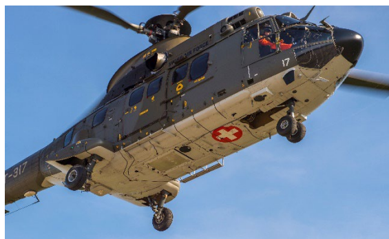
Figure 1 Super Puma des forces aériennes

En quelques heures, un équipement de radiométrie ultrasensible est installé à bord d'un hélicoptère Super Puma des forces aériennes. Afin de cartographier le territoire de manière aussi complète que possible, l'hélicoptère survole le secteur considéré à environ 90 mètres d'altitude en suivant des lignes parallèles, généralement espacées de 250 mètres.