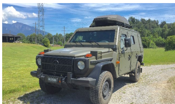
Figure 3 Véhicule de radiométrie