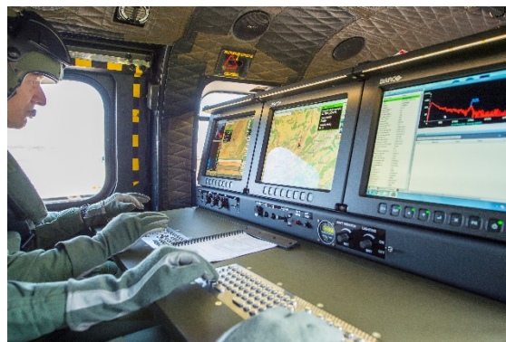
Figure 2 Place de travail des opérateurs

L'orientation omnidirectionnelle des détecteurs permet une localisation précise des éventuelles sources radioactives. La pressurisation de la cabine et la filtration de l'air assure la protection de l'équipage en zone contaminée.