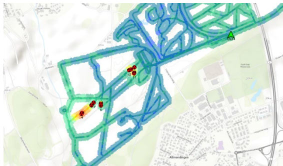
Figure 6 Exercice de recherche de sources radioactives avec un véhicule de radiométrie

Dans certaines conditions, les résultats de mesure sont transmis en temps réel au centre de suivi de la situation du Centre de compétences NBC-DEMUNEX à Spiez. Lors de l'engagement de plusieurs systèmes en parallèle, la centralisation et la fusion de toutes les données permettent une représentation et une évaluation rapide de la situation et créent des conditions favorables pour la gestion d'un incident radiologique et l'échange d'informations entre les différents partenaires civils et militaires.