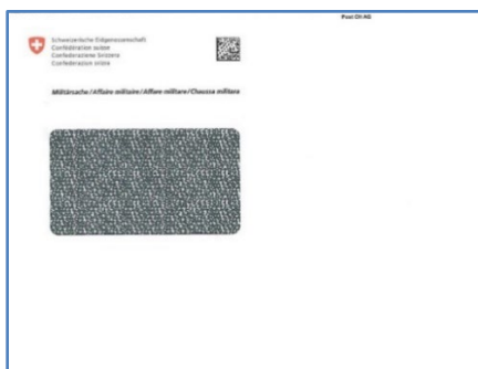
06.151 enveloppe C5 avec fenêtre