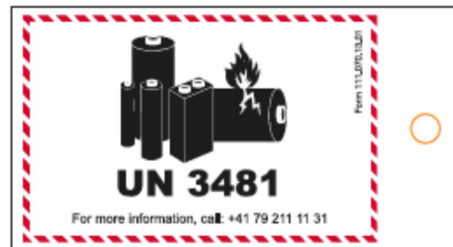
Lithium UN 3481 Blachenstoff mit Öse

Kennzeichen Lithium-Ionen-Batterien in Ausrüstungen oder mit Ausrüstungen verpackt nach Sondervorschrift 188 (SV 188)