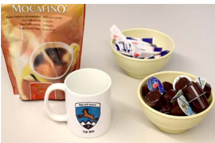
Le mug de la cp EM