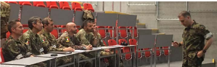
Le commandant présentant le bat inf mont 7

Cette année c'était au tour de l'Italie. Les pays membres échangent chaque année des informations au sujet de leurs forces militaires incluant des inspections sur place.