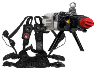
Schiessimulator zu Stgw 90, neue Technologie