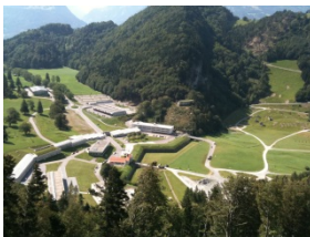
Schiessplatz St. Luzisteig