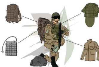
MBAS (Modulares Bekleidungs- und Ausrüstungssystem)