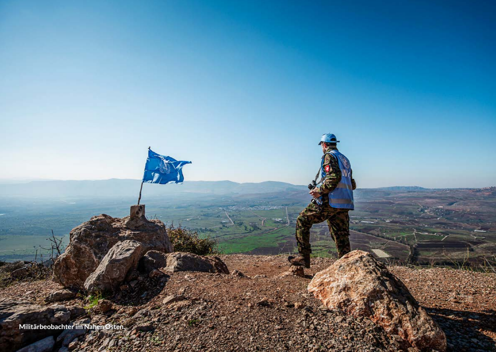
Militärbeobachter im Nahen Osten.