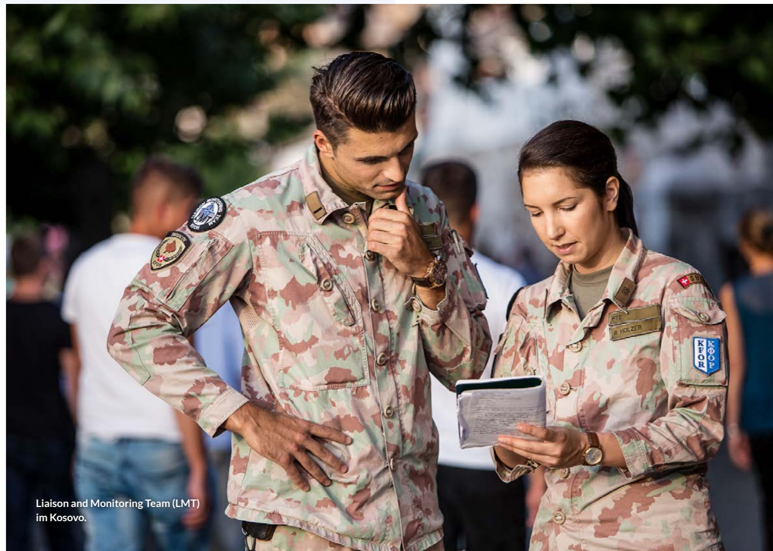
Liaison and Monitoring Team (LMT) im Kosovo.

Für gewisse Funktionen ist das zivile Know-how entscheidend, was auch Frauen mit Schweizer Staatsbürgerschaft ohne militärische Grundausbildung einen Einsatz ermöglicht. Sie werden der Funktion entsprechend militärisch ausgebildet und ausgerüstet.