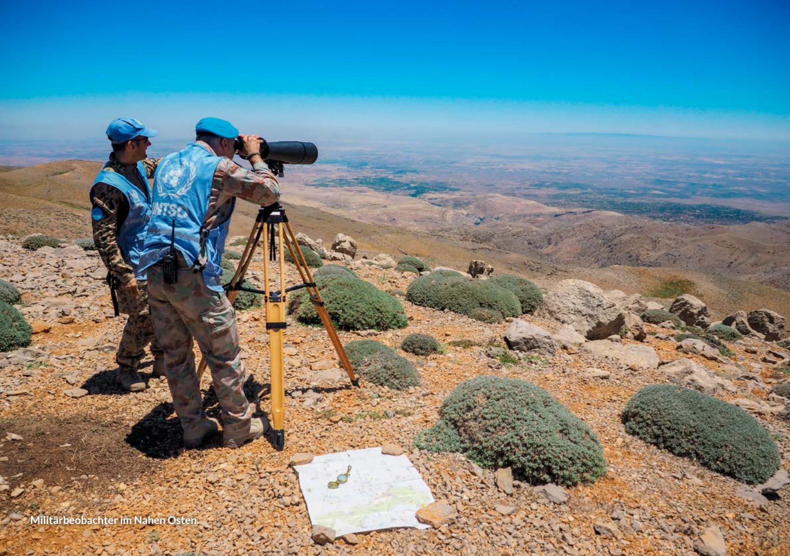
Militärbeobachter im Nahen Osten.