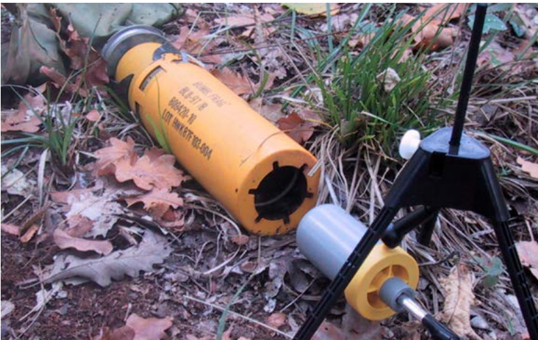
Sichere Sprengung von Blindgängern: Dank des in der Schweiz entwickelten SM EOD-Systems können Blindgänger berührungsfrei vernichtet werden

Die Evaluation der Bundesstrategie 2012–2015 und der Tätigkeiten der Schweiz hat gezeigt, dass der Bund bisher taugliche und wirkungsvolle Massnahmen ergriffen hat. Deshalb besteht kein Grund, das bisherige Engagement fundamental umzugestalten. Vielmehr ist es auf die aktuellen Herausforderungen anzupassen und in diesem Sinne weiterzuführen. Das Potenzial der heutigen Zusammenarbeit innerhalb der Bundesverwaltung und mit externen Partnern zugunsten der humanitären Minen-