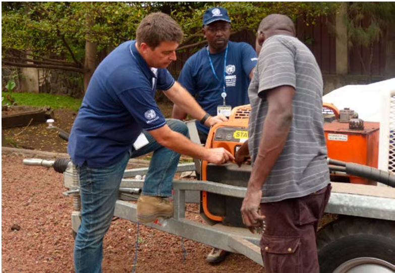
Schweizer Logistiker im Einsatz für das Minenräumprogramm der UNO in der Demokratischen Republik Kongo: Ausbildung am Generator