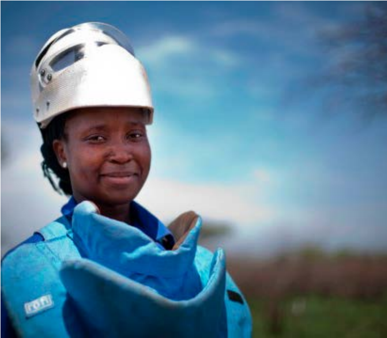
Job well done: Minenräumerin in Mozambique