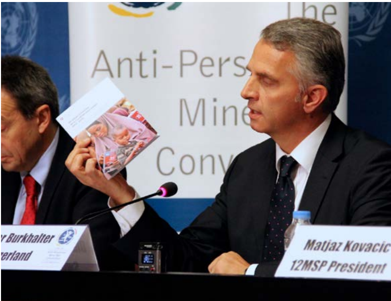
Internationales Engagement: Bundesrat Didier Burkhalter anlässlich des 12. Vertragsstaatentreffens zum Personenminenübereinkommen

Aus den oben genannten aktuell bestehenden Herausforderungen ergibt sich für die Schweiz die Erkenntnis, dass ihr Engagement trotz zahlreicher Erfolge im Bereich der humanitären Minenräumung bis 2022 unabdingbar ist. Dies umso mehr, weil die negativen Auswirkungen von Minen, Streumunition und explosiven Kriegsmunitionsrückständen sowie der vermehrte Einsatz von IEDs das humanitäre, friedensfördernde und entwicklungspolitische Engagement des Bundes nachhaltig behindern und letztlich die Erreichung der Verfassungsziele 6 erschweren. Der Bundesrat hat denn auch die Bedeutung der humanitären Minenräumung in verschiedenen aussen- und sicherheitspolitischen Berichten unterstrichen. Vor diesem Hintergrund wird die Minderung der von Minen, Streumuni-