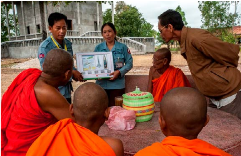
Umfassende Sensibilisierung über die Gefahren: Mine Risk Education in einem kambodschanischen Kloster

Bezüglich des finanziellen Engagements der Geberstaaten in der humanitären Minenräumung konnte bisher von einem sehr ansprechenden Niveau berichtet werden. So stehen z.B. seit 2008 – trotz globaler Finanzkrise – jährlich über 600 Millionen US-Dollar im Kampf gegen Minen, Streumunition und explosive Kriegsmunitionsrückstände zur Verfügung. Dennoch ist festzuhalten, dass Einsparungen in diesem Bereich kein politisches Tabu mehr darstellen. Der Enthusiasmus scheint einem Pragmatismus zu weichen, weshalb sich die politische Unterstützung gerade heute nicht mehr immer in eine finanzielle Unterstützung übersetzen lässt.