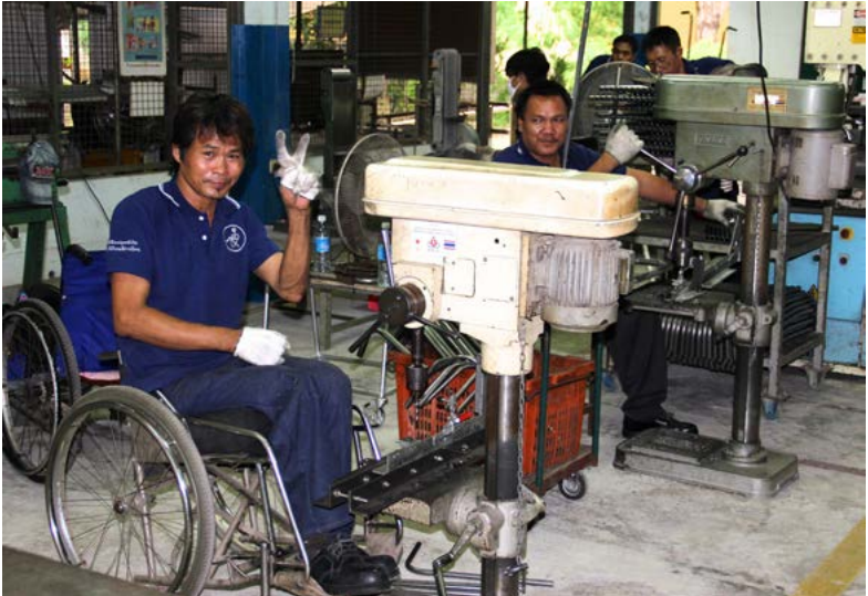
Minenopfern eine Perspektive geben: Integration in die Arbeitswelt in Thailand

Auch bei den Opferzahlen ist ein positiver Trend zu verzeichnen. War vor 25 Jahren im Schnitt noch alle 20 Minuten ein Opfer von Minen, Streumunition oder explosiven Kriegsmunitionsrückständen zu beklagen, so sind es heute noch schätzungsweise 10 Personen pro Tag 1 . Dies sind noch immer zu viele Menschen; die Verbesserung der Situation ist dennoch unübersehbar.