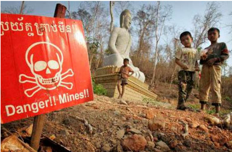
Hoffentlich bald auf sicherem Grund: Spielende Kinder nahe einem buddhistischen Schrein in Kambodscha

Schwerpunkt 2.1: Durch die Räumung von Minen, Streumunition und explosiven Kriegsmunitionsrückständen werden die Risiken für die Bevölkerung gemindert und der Zugang zu lokalen Ressourcen wird ermöglicht.