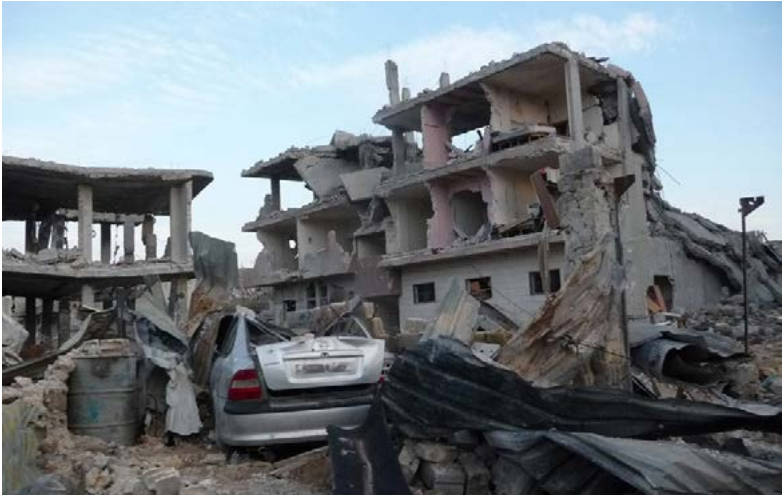
Massive Zerstörungen nach Kampfhandlungen in einer syrischen Stadt

Gemeinschaften kann nur durch die globale Einhaltung und Umsetzung der Verpflichtungen dieser Übereinkommen nachhaltig gewährleistet werden. Zum anderen sind Staaten gelegentlich nicht in der Lage, die Umsetzung der Verpflichtungen mit der gebotenen Zügigkeit vorzunehmen, weshalb es zum Beispiel in der Räumung kontaminierter Gebiete zu Verzögerungen gekommen ist.