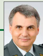
Brigadiere Stefano Mossi, 1964