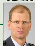
Brigadiere Franz Nager, 1961