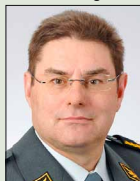
Brigadiere Melchior Stoller, 1961