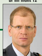
Brigadier Franz Nager, 1961