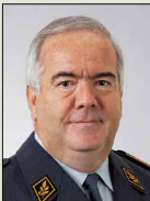
Commandant de corps Dominique Andrey, 1955

Commandant des Forces terrestres / remplaçant du chef de l'Armée