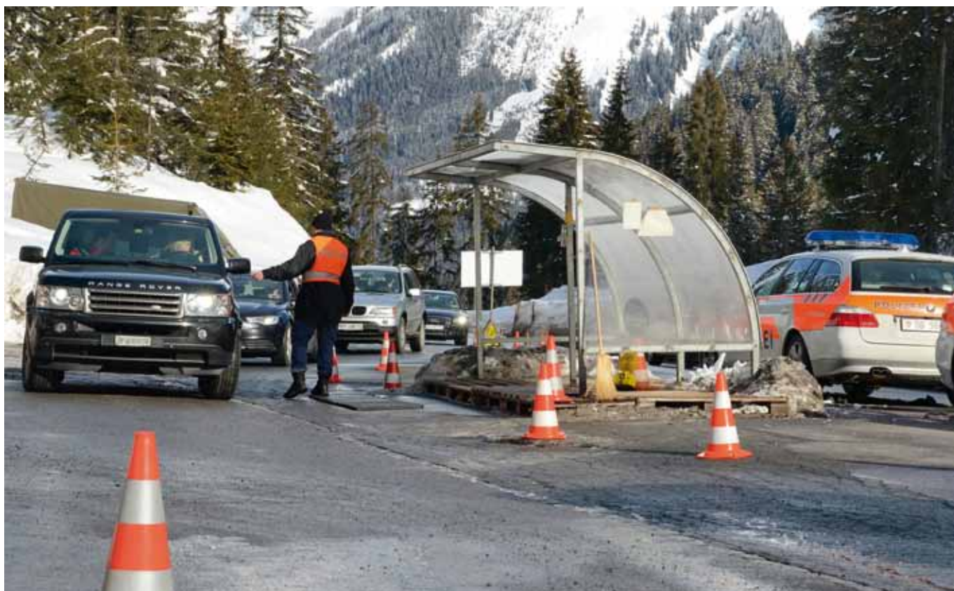
Durch diese Gasse müssen sie fahren: Kontrollplatz Grünbödéli.

High-Tech-Geräte gehören bei der Personenkontrolle bei den Kontrollplätzen Landwasser und Grünbödéli genauso dazu wie die menschliche Intuition. CUMINAIVEL hat den Kontrollplatz Grünbödéli besucht.