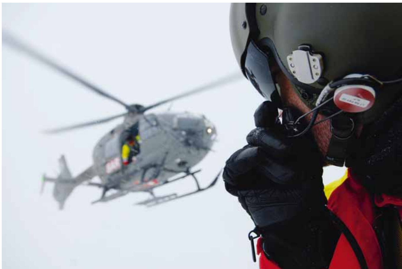
Der Notarzt am Boden leistet erste Hilfe und ist über Funk mit dem Heli verbunden.

Was passiert, wenn ein WEF-Soldat bei einem Unfall «1414» für die Rega wählt? Er bekommt mitunter Hilfe aus einem Heli in Tarnfarbe. Während militärischen Grossereignissen wie dem WEF wird auch die Luftwaffe für Rettungen eingesetzt.