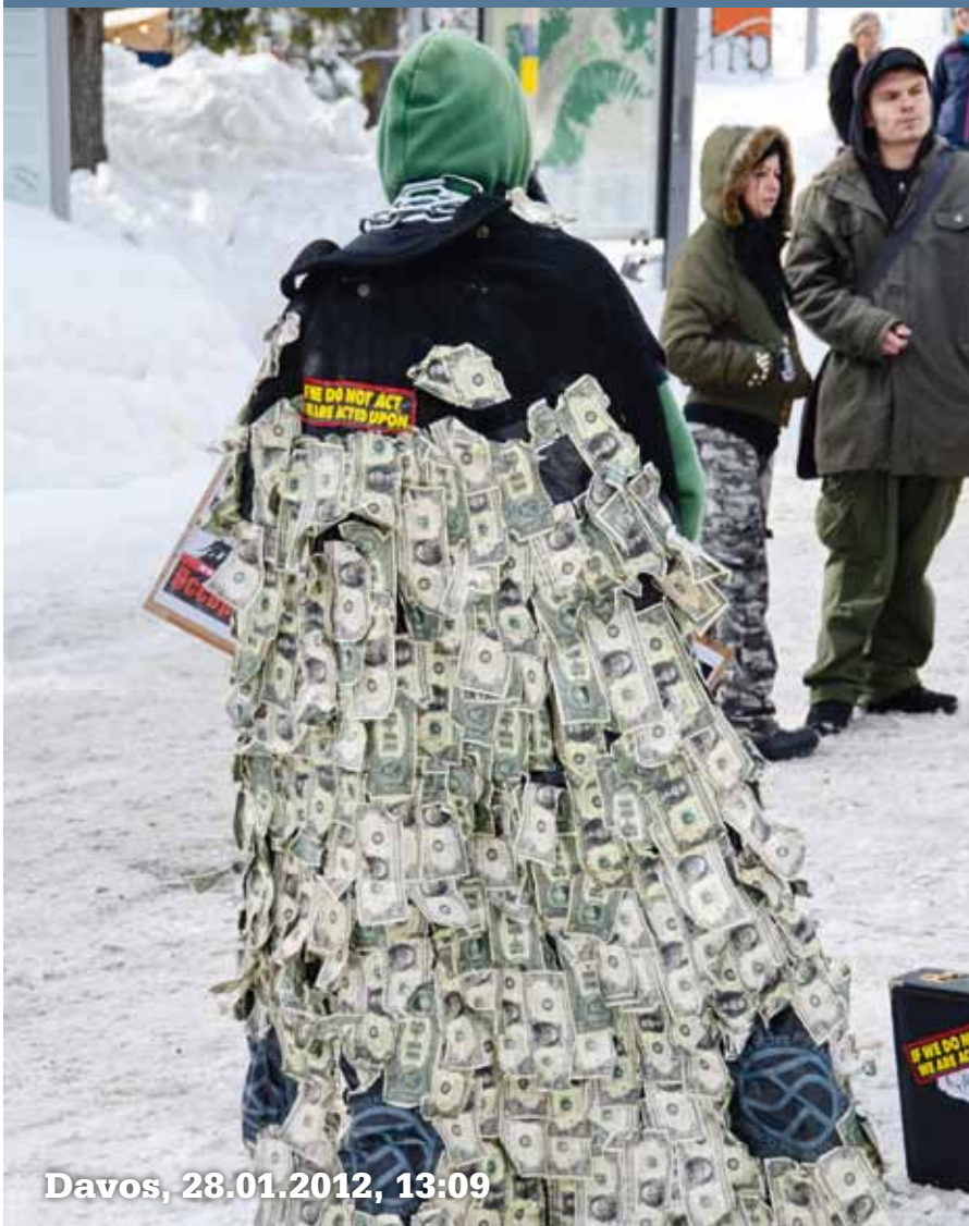
Davos, 28.01.2012, 13:09