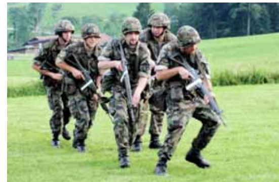
12 Logistik-Bataillon 101 Einsatz fürs Eidgenössische Schwing- und Älplerfest