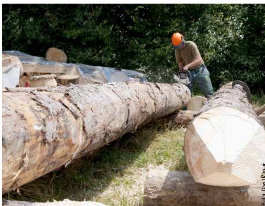
Ein Geniesoldat schneidet mit der Kettensäge die Pfähle für den Brückenbau zurecht.