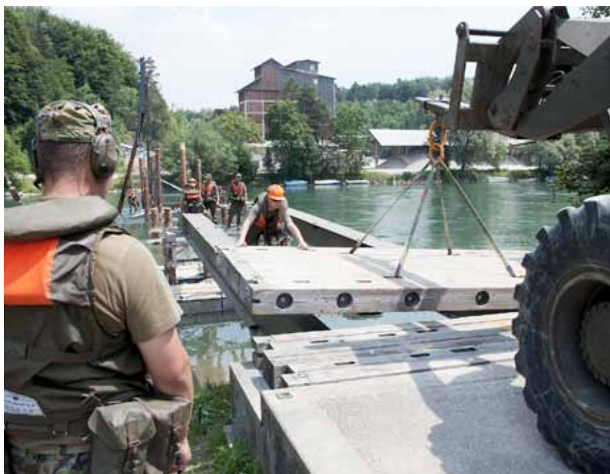
Genisten an der Arbeit: Die eingeflogenen Brückenelemente werden laufend verbaut.

der Planung über die Führung bis zur Umsetzung beurteilen», erklärt Divisionär Müller. Um Übungen wie BELUGA und STABANTE durchführen zu können, benötige man eine kompetente Übungsleitung. Diese setzt sich jeweils aus erfahrenen Milizoffizieren zusammen, die ihre letzten verbleibenden Dienstage als Übungsleiter absolvieren. «Sie halten der beübten Truppe und somit der gesamten Luftwaffe den Spiegel vor und zeigen, wo Anspruch und Wirklichkeit auseinanderklaffen. Dies löst einen Lernprozess aus, dessen Erfolg bei späteren Übungen erneut geprüft wird», hält Müller fest. ■