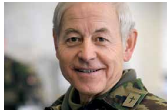
6 Hauptmann Fritz Sartorius Er ist Armeeseelsorger und ältester aktiver Offizier der Schweizer Armee