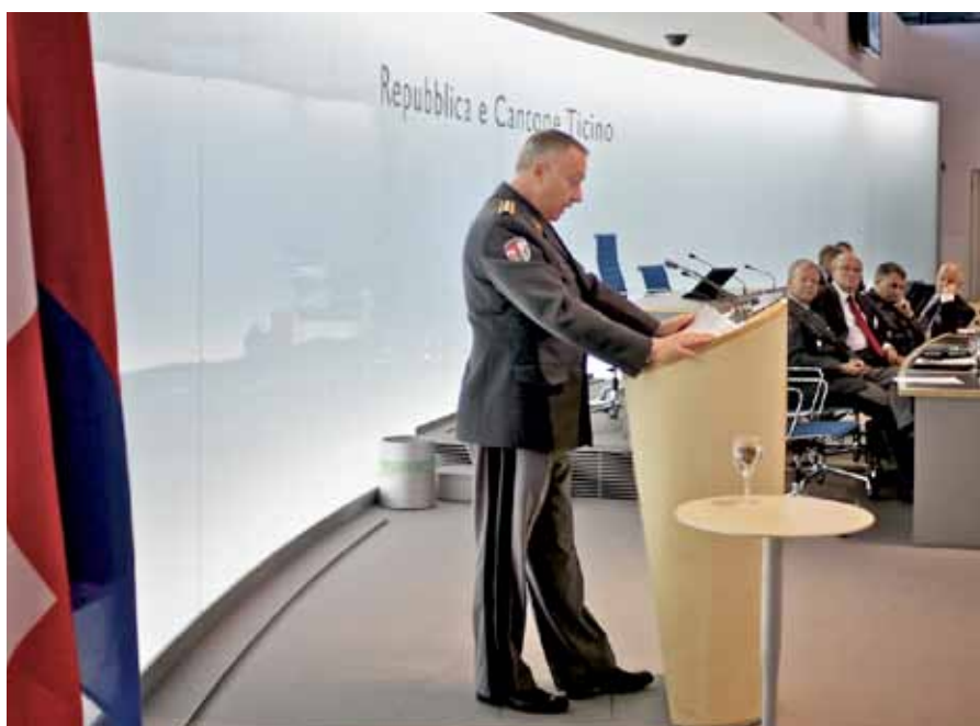
Oktober 2010, Bellinzona: Anlässlich des Lunch-Events der Territorialregion 3 spricht der Chef der Armee vor Politikern und Meinungsführern aus der Südschweiz (Bild oben) und gibt im Fernsehstudio von RSI («Radiotelevisione svizzera di lingua italiana») ein Interview.

zeptanz militärischer Karrieren in Unternehmen wieder steigern. Wir zeigen Ihnen einige Impressionen von ausgewählten Anlässen dieses Jahres. Komm V